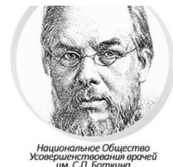
Национальное Общество Усовершенствования врачей им. С.П. Боткина